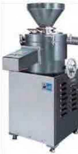
GRANOMAT JP 360