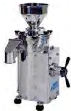
GRANOMAT JP 150