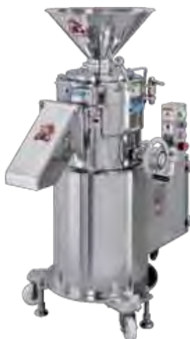
GRANOMAT JP 250